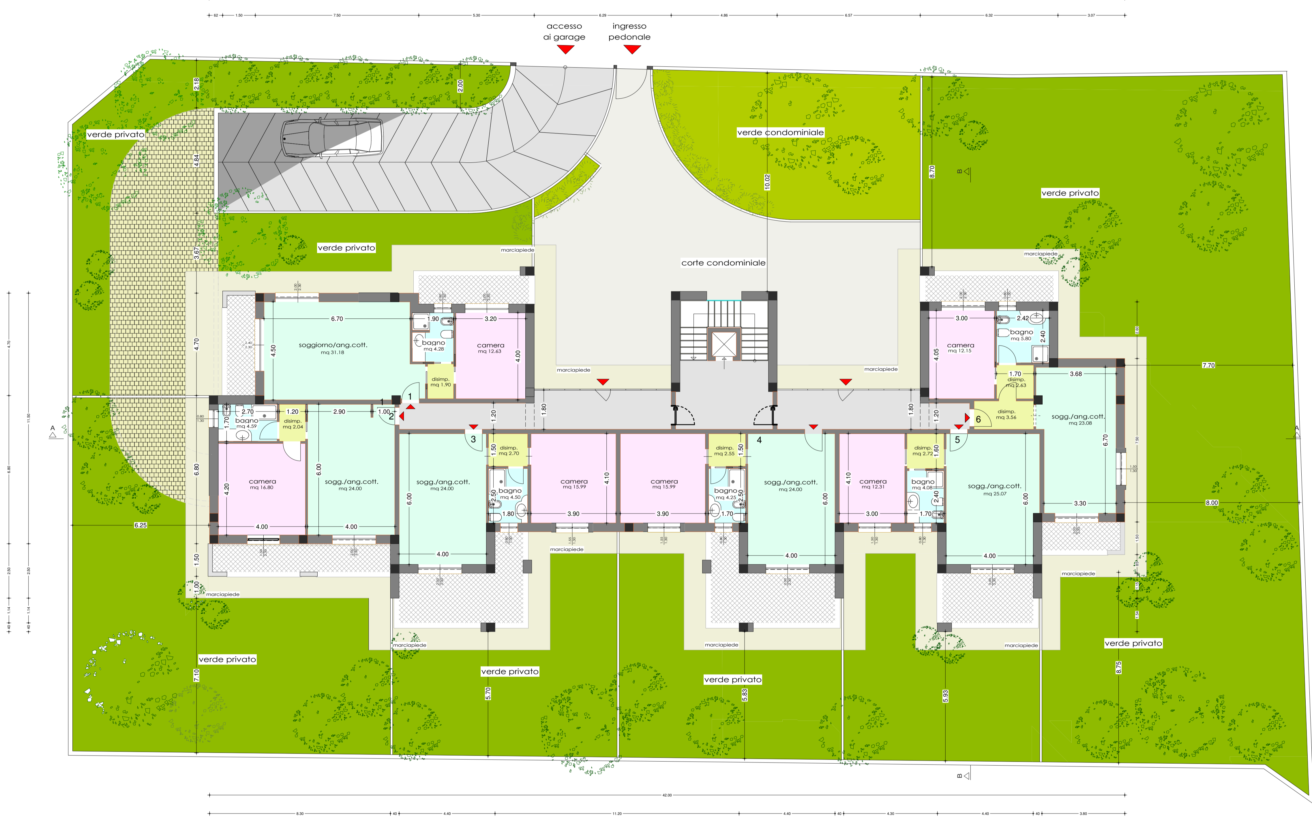
PIANTA PIANO TERRA * scala 1:100