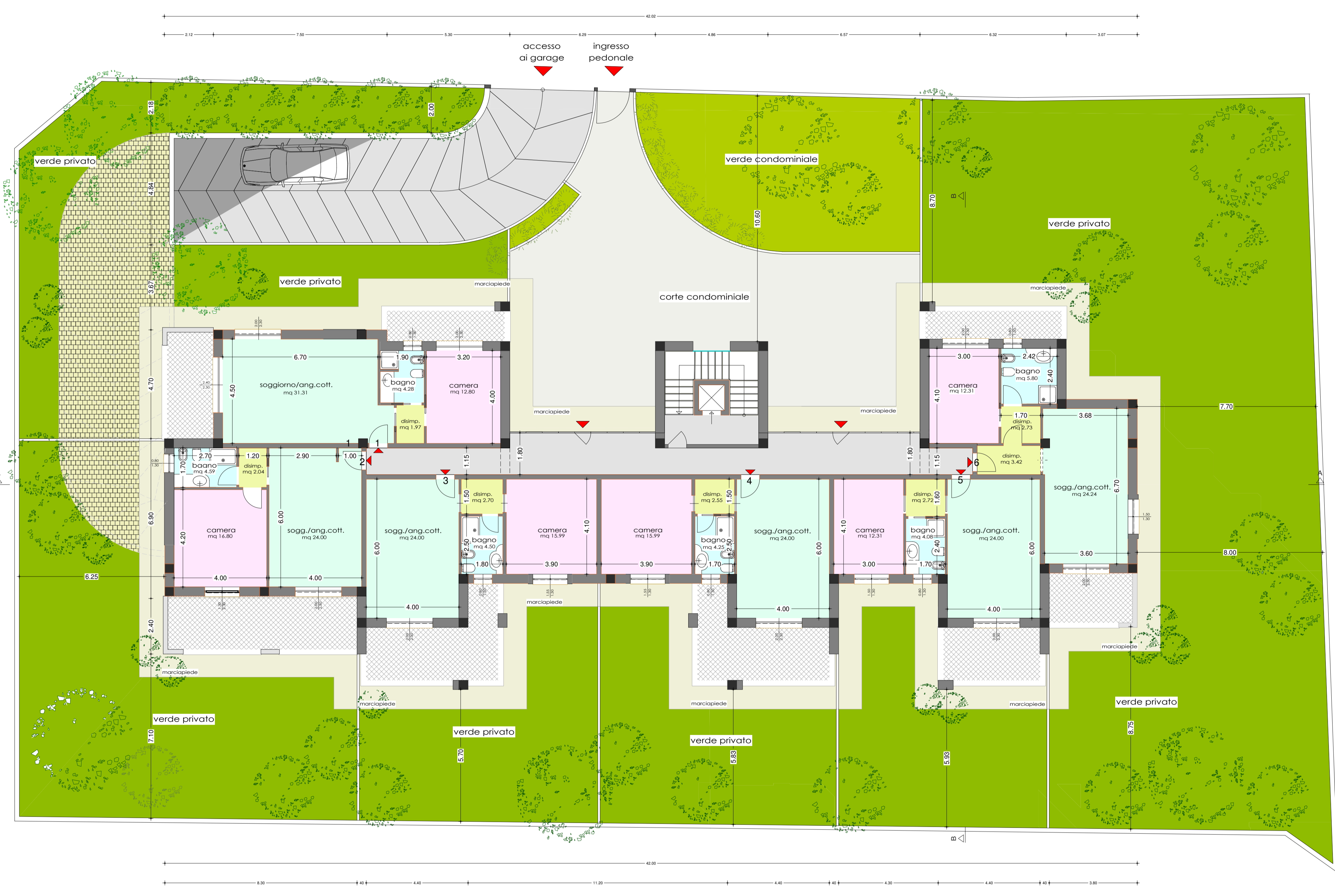
PIANTA PIANO TERRA * scala 1:100