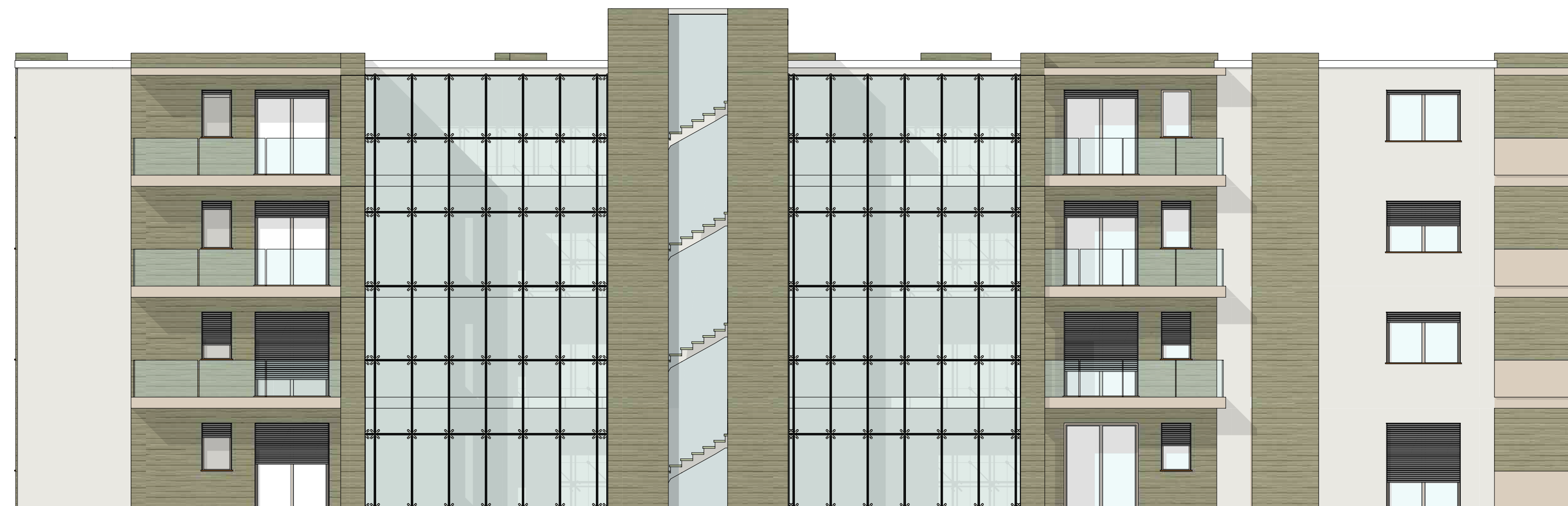
PROSPETTO NORD * STATO IN PROGETTO