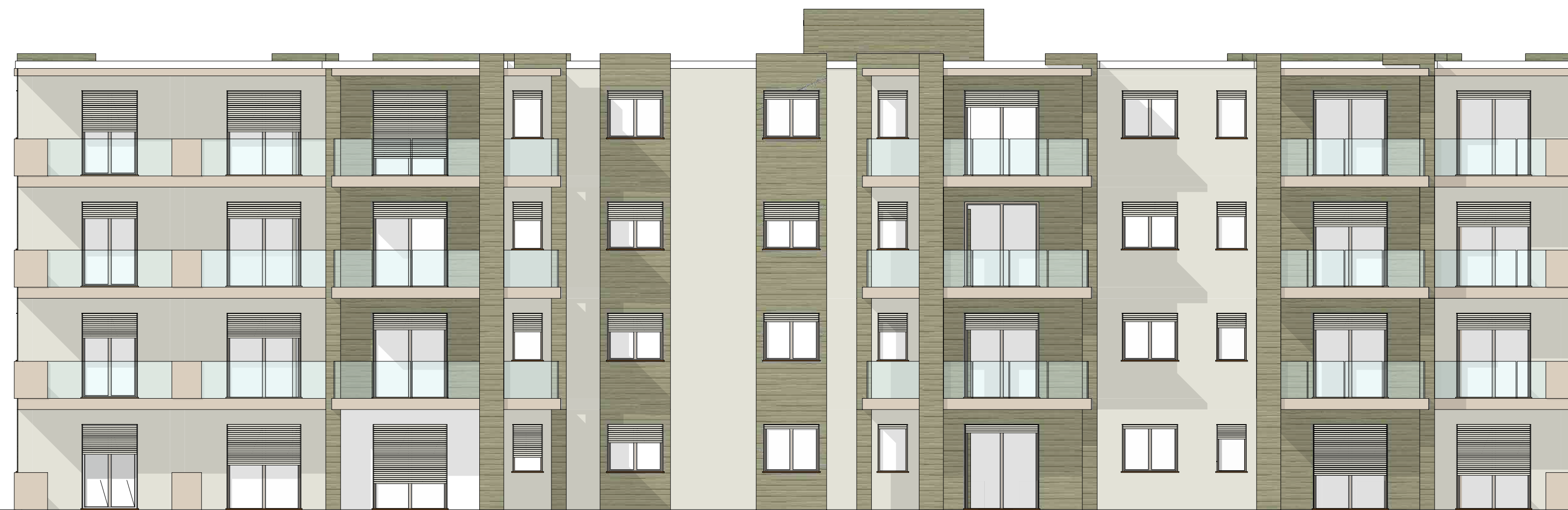
PROSPETTO SUD * STATO IN PROGETTO