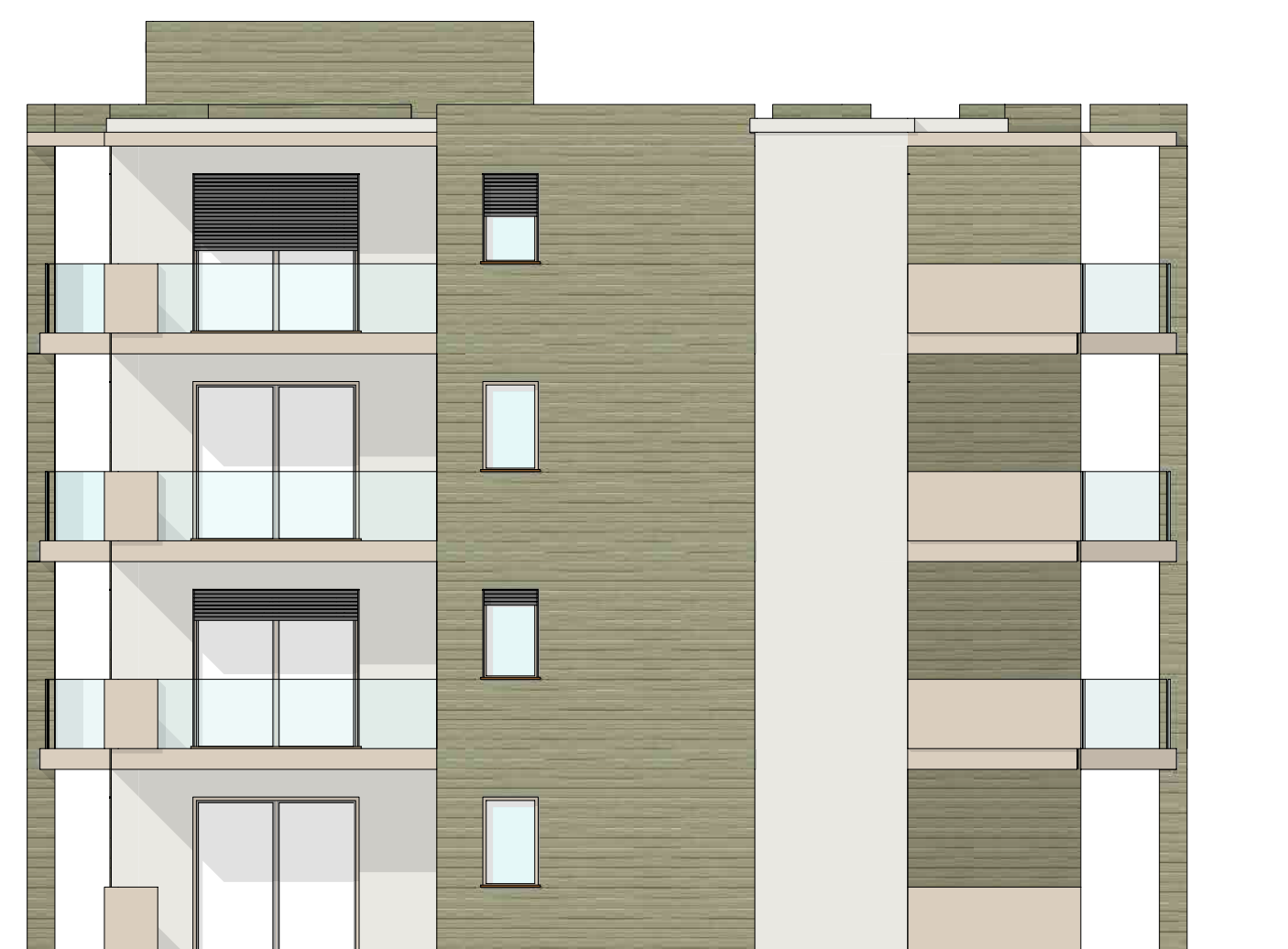
PROSPETTO OVEST * STATO IN PROGETTO