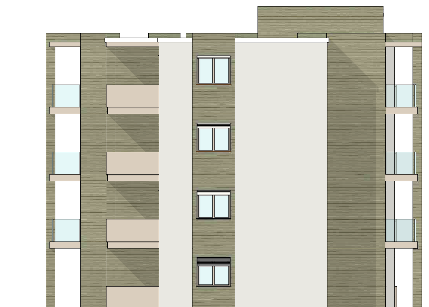
PROSPETTO EST * STATO IN PROGETTO